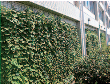
受付のグリーンカーテン