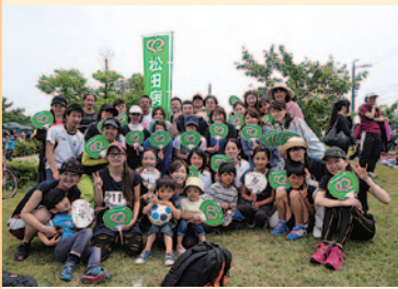
毎年恒例の佐鳴湖駅伝にて(5月)

8月下旬から急に涼しくなりましたが、今年の夏も暑かったですね。松田病院では夏に職員の「ビアパーティー」が開かれます。今年はあるグループが出しもの「恋するフォーチュンクッキー」を披露したところ、それを全員で踊るという事態に発展し、パーティー会場に異様な光景(?)がひろがりました。暑さ倍増でしたが、この一体感が松田病院の良さだと思えました。